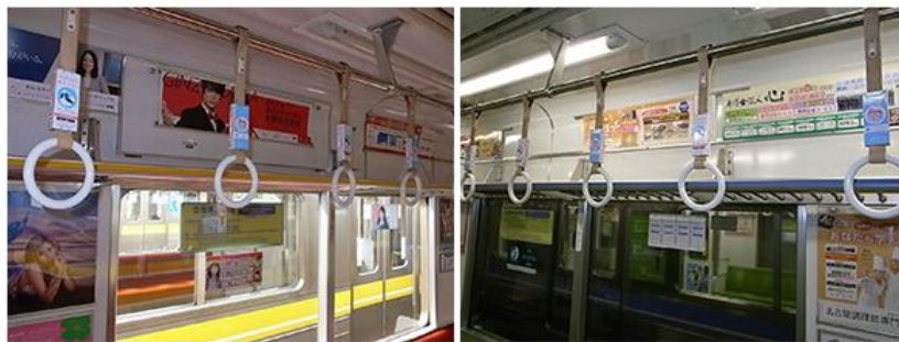
東山線・名城線車内

当社は、妊活・妊娠・出産・育児の記録をひとつのアプリで簡単に管理ができる「ママケリー」の提供に加え、妊産婦さんが身につけることで周囲が配慮を示しやすくする「マタニティマーク」の応援を通して、妊婦さんをサポートしてまいります。