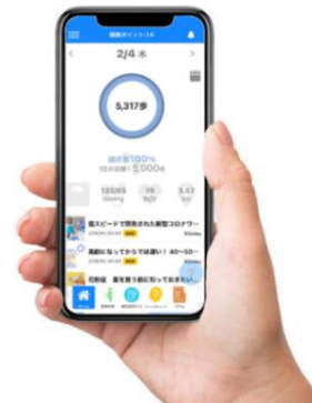
ヘルス×ライフ 画面イメージ