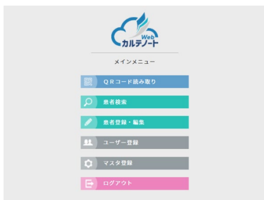
◇メインメニュー画面イメージ