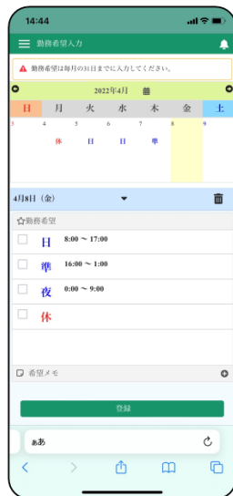
従業員がスマホで希望日入力