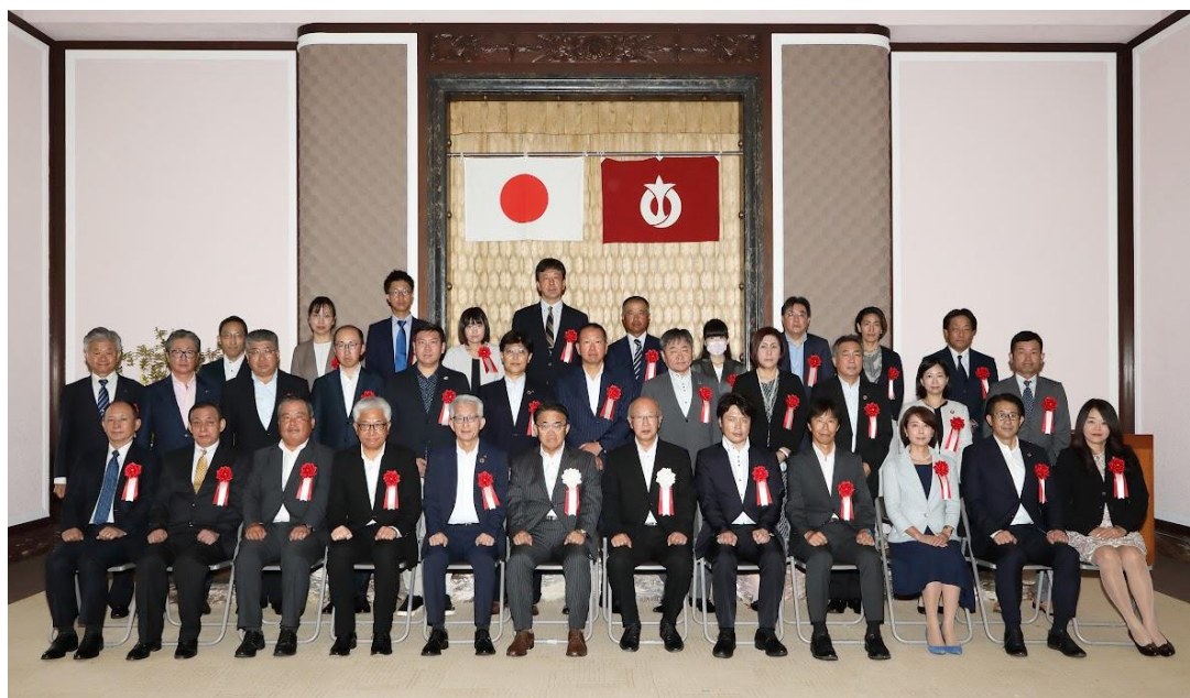
令和4年度健康宣言優良事業所表彰式 2022年度「あいち健康経営アワード」表彰式 合同開催 令和5年9月6日